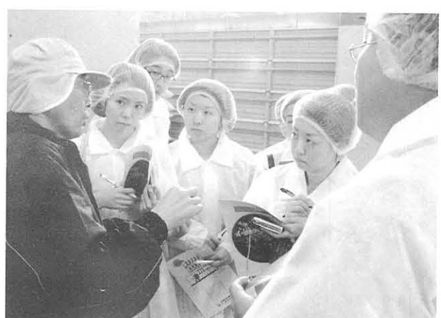
ユニマツトキャラバン(株)横浜工場 横浜市金沢区幸浦2-17-4